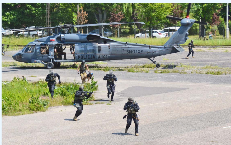
Fot. 6. Współpraca z zespołem bojowym.

niach. W momencie, gdy dojdzie do zatrzymania przez psa osoby ukrywającej się, pies nie powinien zwracać uwagi na operatorów zespołu. Pies w działaniach powinien być całkowicie obojętny na operatorów, na ich ruch – przemieszczanie się, a nawet dać się prowadzić innej osobie niż przewodnik, gdyż w wyjątkowych sytuacjach w realnym działaniu przewodnik może doznać kontuzji lub zostać ranny.