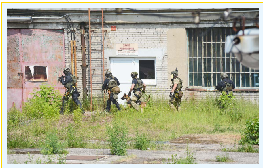
Fot. 7. Podejście z zespołem bojowym.

go się poza jego zasięgiem, powinien zacząć sygnalizować jego odnalezienie poprzez drapanie, szczekanie, próbę dostania się do miejsca ukrycia. Zespół bojowy po usłyszeniu sygnałów psa o ataku/odnalezieniu pozoranta zgodnie z taktyką i techniką przemieszcza się w kierunku napastnika. W przypadku zatrzymania sprawcy przez psa przewodnik jak najszybciej „odrywa” go od pozoranta. W przypadku gdy pies nie może zaatakować pozoranta, sygnalizuje odnalezienie osoby ukrywającej się, a jednocześnie niedostępnej dla psa, w zależności od taktyki przewodnik umożliwia psu dostanie się do pozoranta lub odciąga psa i napastnik zostaje zatrzymany przez operatorów zespołu bojowego.