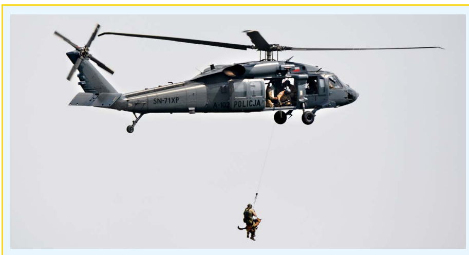
● Fot. 3. Ćwiczenia wysokościowe z wykorzystaniem śmigłowca.

wysokościowego znajdującego się na pokładzie śmigłowca. Gdy cały zespół bojowy zjedzie, pies zostaje przeczepiony na smycz i zgodnie z taktyką operatorzy zespołu bojowego przemieszczają się w miejsce zadania. Pies po zjechaniu ze śmigłowca powinien zachowywać się spokojnie, koncentrować się na przewodniku i być gotowy do dalszego działania.