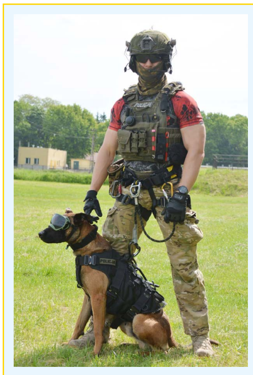
● Fot. 2. Pies w oporządzeniu wysokościowym.

Operatorzy zespołu bojowego wraz z przewodnikiem i psem przemieszczają się śmigłowcem, wszyscy są ubrani w odpowiedni sprzęt wysokościowy, pies jest ubrany w szorki do ćwiczeń elementów wysokościowych oraz gogle ochronne. Gdy tylko znajdą się nad miejscem działań, opuszczają pokład śmigłowca, zjeżdżając na linach. Pies na pokładzie śmigłowca musi zachowywać się spokojnie. Przed zjazdem przewodnik otrzymuje dodatkową asekurację od członków zespołu bojowego. Pies jest przyczepiony za pomocą krótkiej linki i karabińczyka do przewodnika. Opuszczając pokład, pies nie powinien się zapierać i wykazywać oznak lęku przed wysokością. Zjazd jest nadzorowany przez instruktora