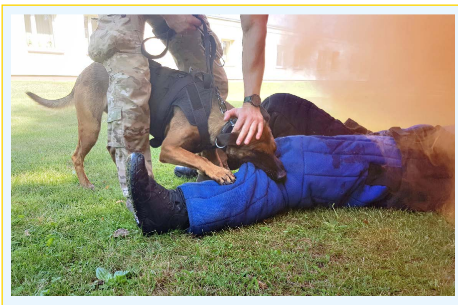
Fot. 1. „Pełny chwyt”.