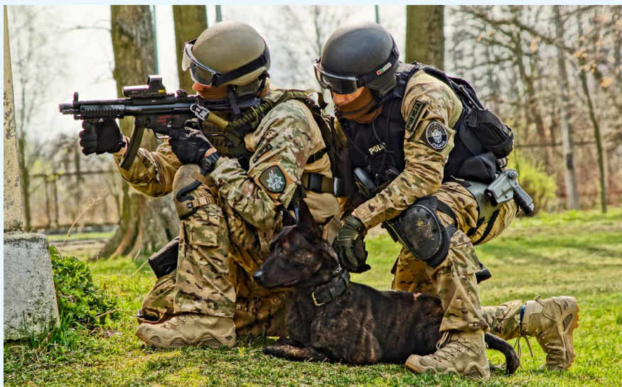
Fot. 5. Współpraca z zespołem bojowym, nauka w początkowej fazie szkolenia. Zdj. D. Ratajczak.