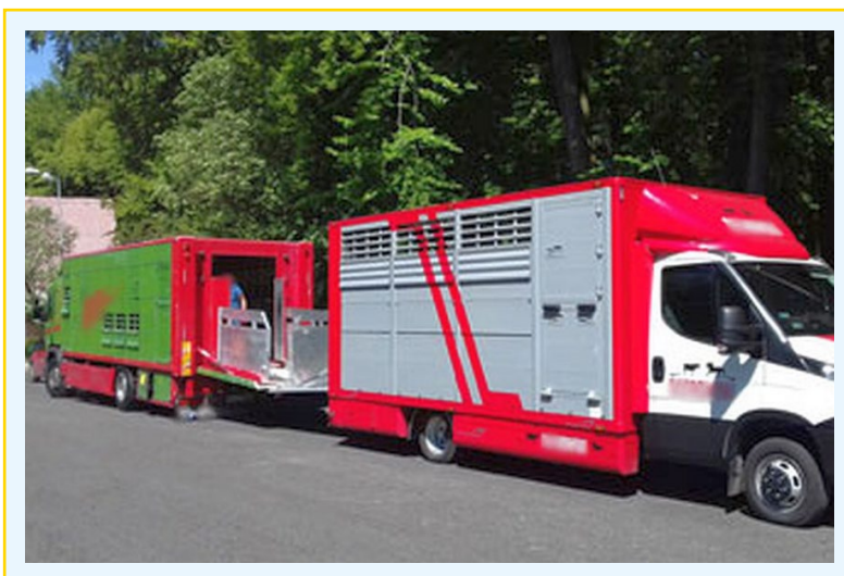
Fot. 6. Przeładunek zwierząt.

Lekarz weterynarii na miejscu wypadku drogowego podejmuje decyzję co do dalszego postępowania ze zwierzętami. Zwierzęta zdolne do transportu powinny być załadowane do innego środka transportu w celu jego kontynuacji.