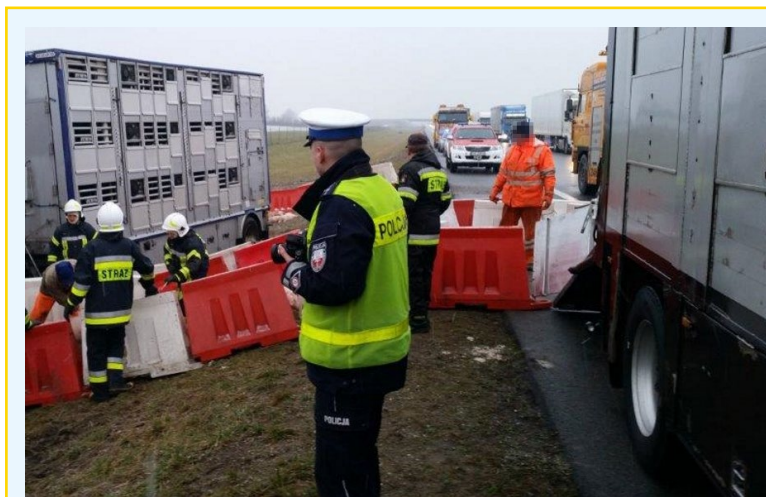
Fot. 2. Obowiązki policjanta.

ma obowiązek zająć się ładunkiem. Jest on osobą przeszkoloną w zakresie wykonywania czynności podczas transportu lub obsługi zwierząt.