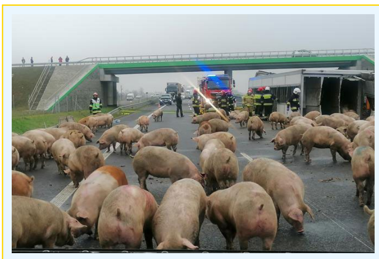
● Fot. 4. Zapanowanie nad zwierzętami.

Zwierzęta w zależności od gatunku różnie będą reagowały na tak skrajny stres. Jedne się spłoszą i będą uciekały, a drugie zaatakują. Policjant musi ocenić sytuację, z jakimi zwierzętami ma do czynienia, i podjąć właściwy kierunek działania. Gdy są to zwierzęta dzikie bądź niebezpieczne, powinien zachować szczególną ostrożność. Nie powinien się do nich zbliżać, ponieważ mogłoby to u nich wzbudzić strach i wywołać agresję. Należy ustawić radiowóz w bezpiecznej odległości i podjąć niezbędne działania do czasu przyjazdu odpowiednich służb. W myśl art. 33 ust. 4 ustawy o ochronie zwierząt w przypadku konieczności bezzwłocznego uśmiercenia w celu zakończenia cierpienia zwierzęcia policjant powinien wezwać osobę odpowiedzialną za przeprowadzenie działań, tj. lekarza weterynarii. Lekarze z powiatowego inspektoratu weterynarii nie posiadają żadnych leków, więc czynności te najczęściej zlecają lekarzom weterynarii, którzy mają prywatne praktyki. Wobec zwierząt wolno żyjących (dzikich) policjant może użyć broni palnej. Niemniej jednak niniejszy przepis może być zastosowany w opisywanych okolicznościach tylko i wyłącznie, gdy zażądzie taka konieczność. W celu zminimalizowania skutków zdarzenia należy ściśle współpracować ze wszystkimi służbami w trakcie przemieszczania zwierząt, usuwania pojazdu oraz porządkowania drogi.