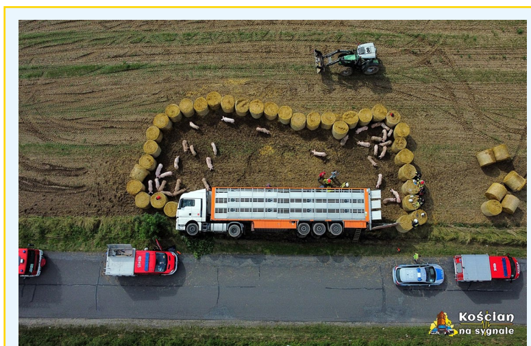
Fot. 3. Zlokalizowanie zwierząt w jednym miejscu.