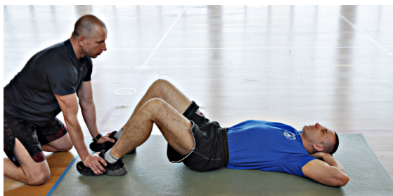
Fot. 1 i 2. Siady z leżenia tyłem w ciągu 30 sekund.