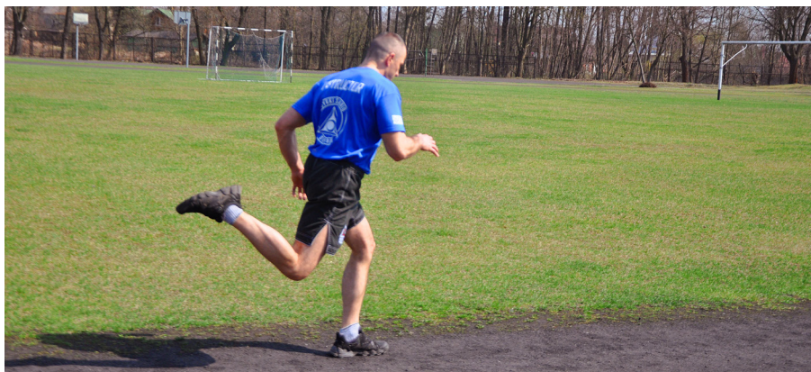
Fot. 6. Bieg na 800 m (1000 m).