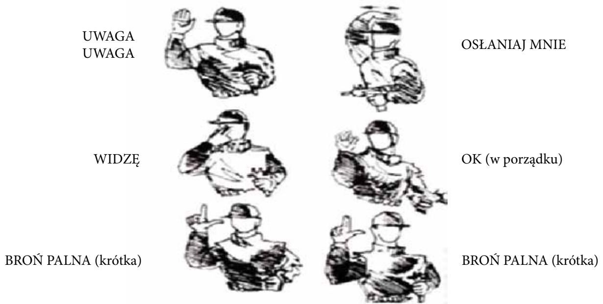
Rys. 1. Niektóre umowne znaki sygnalizacyjne używane przez policjantów

Wzrost bezpieczeństwa w czasie realizacji działań i czynności służbowych zapewni również metoda znaków umownych 19 . Do porozumiewania się i sygnalizowania pewnych faktów, stanów lub zamiarów działania policjanci używają znaków umownych za pomocą rąk i dłoni. Liczba, sposób wyrażania i znaczenie takich znaków mogą być różne, w zależności od poczynionych wcześniej uzgodnień. Pewna zgodność występuje co do znaków używanych najczęściej przez policjantów w czasie wykonywania zadań służbowych, a mianowicie: