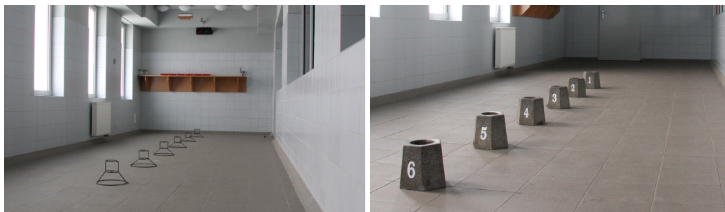
● Fot. 1 i 2. Ciągi selekcyjne z wykorzystaniem stojaków metalowych i kamionkowych.

W ćwiczeniach wykorzystuje się metalowe lub kamionkowe statywy do stoików, stoiki z nakrętkami typu twist o pojemności 0,9 litra, sterylne tampony zapachowe produkcji Toruńskich Zakładów Materiałów Opatrunkowych, kleszcze chirurgiczne (Pean, Kocher) lub pęsety o długości min. 30 cm, dzbanki plastikowe do nawęszania, deski do krojenia, noże i pojemniki na smakołyki.