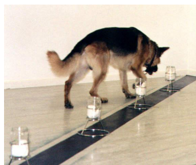
Fot. 9. Samodzielna praca psa w ciągu selekcyjnym.