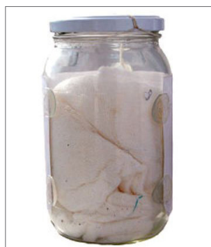
● Fot. 3. Konserwa zapachowa.

Jako smakołyki wykorzystuje się drobno pokrojoną kielbasę – użycie suchej karmy (chrupek) jest niedozwolone, gdyż psy takie smakołyki rozgryzają i zbierają z podłoża wszystkie okruszki, co zaburza rytm pracy. Materiały zapachowe do ćwiczeń są zabezpieczane przez słuchaczy w ramach ćwiczeń praktycznych podczas realizacji zajęć w bloku II „Wybrane elementy kryminalistyki”, temat nr 1 „Ślady osmologiczne”, zagadnienie nr 5 „Ujawnianie, zabezpieczanie oraz pobieranie śladów kryminalistycznych oraz materiałów porównawczych w zakresie śladów osmologicznych”.