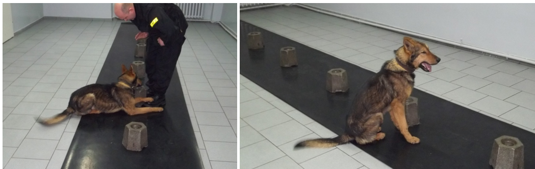
● Fot. 6 i 7. Zaznaczanie przez psa właściwego stanowiska poprzez warowanie lub siadanie.