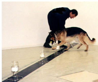
Fot. 8. Praca psa i przewodnika w szeregu selekcyjnym.